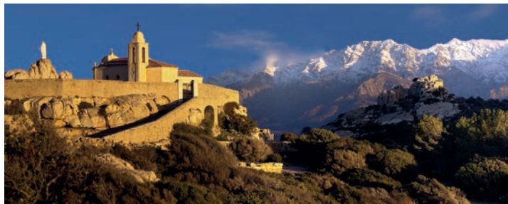
Chapelle de pèlerinage de Notre Dame de la Serra