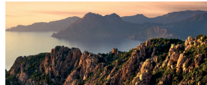
Les Calanches de Piana