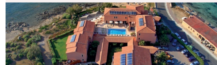
Best Western Santa Maria

Prix par personne en chambre double Supplément chambre individuelle hôtels et bateau Fr. 285.- (limitées)