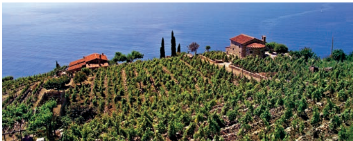
vignobles près de Capoliveri