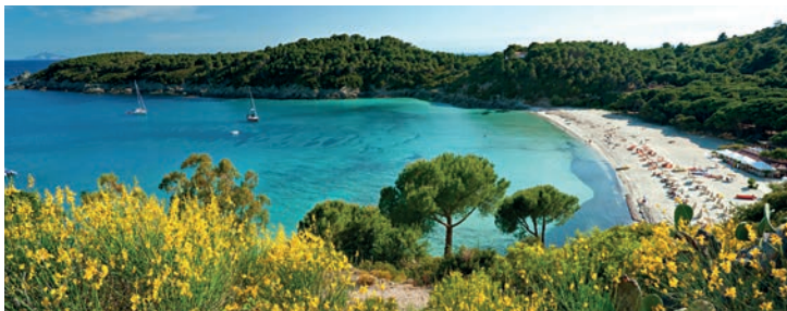
plage de Sant'Andrea